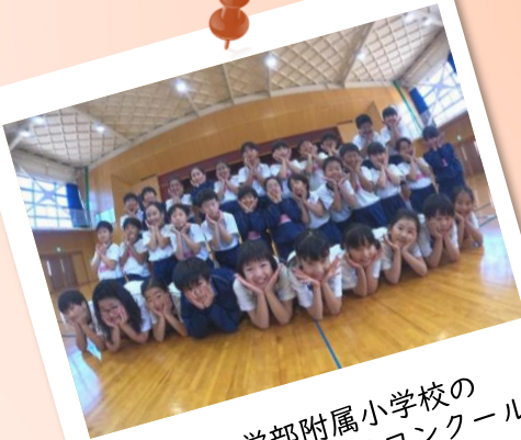
教育学部附属小学校の 2チームがダンスコンクール 全国決勝大会に出場!