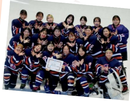
女子アイスホッケー部 日本学生女子アイスホッケー 大会で3位奪還!